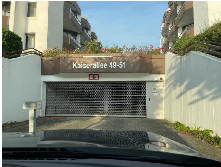
Zufahrt zur Tiefgarage mit eigenem PKW-Stellplatz