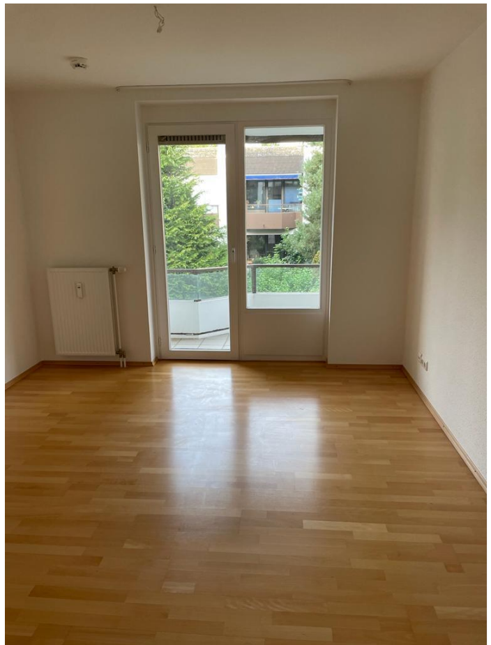
Eingangsbereich zum Schlafzimmer und in den Wohnbereich – Schlafzimmer mit eigenem Balkon