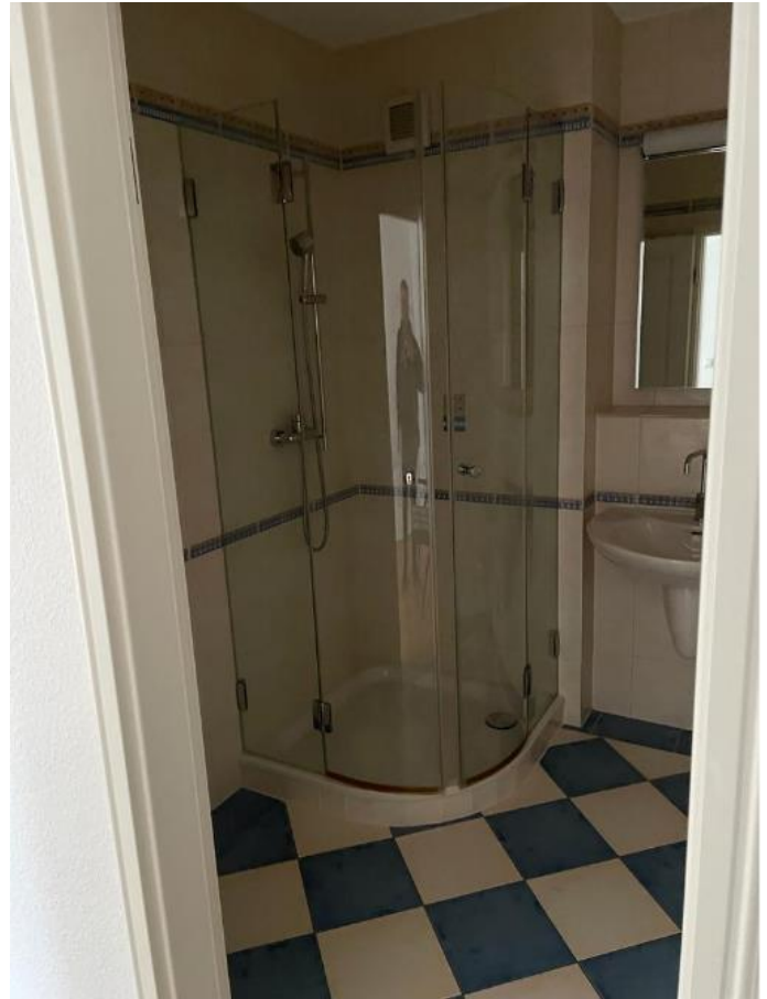
Zugang zum Balkon im Wohnzimmer - Dusche im Badezimmer